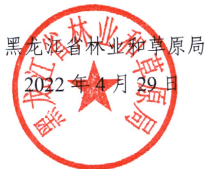
黑龙江省林业和草原局