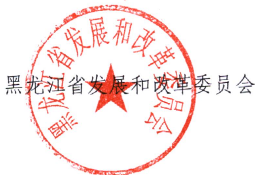
黑龙江省发展和改革委员会