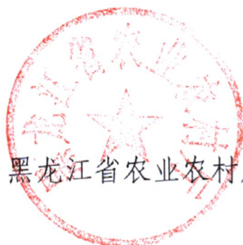
黑龙江省农业农村厅